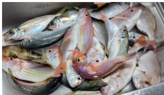
（内原 博 記）