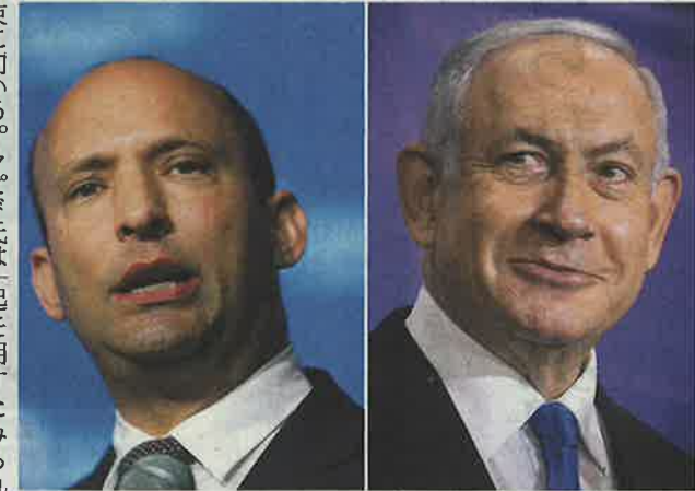
イスラエルのネタニヤフ首相(写真右)と次期連立政権で首相に就くとしたベネット氏

【カイロ】久門武史「政治の混乱が続くイスラエルで2日、ネタニヤフ首相の続投に反対する野党が連立政権の樹立で合意したと発表した。連続12年、通算15年にわたり首相を務めるネタニヤフ氏が退陣し、後任に国防相などを歴任したナフタリ・ベネット氏(49)が就任する可能性が強まった。 連立交渉を主導する最大野党の中心「イエシユアティド」党首のラビド・アビグドールが、組閣に成功したとラビン大統領に報告した。まずベネット氏が首相に就き、約2年後にラビド氏に譲る首相ポストの輪番制を採るとした。 右派「ヤミナ」を率いるベネット氏が5月30日に連立参加を表明後、連立交渉が加速し、2日深夜の組閣期限切れ直前に発表にこぎ着けた。左右両派と中道政を糾合し、計8党が加わる。アラブ系政党が同国で初めて連立政権入り合意した。「反ネタニヤフ」の一点を除いて政策の共通点は乏しく、結束の弱さが指摘されている。 新内閣は国会の承認を経たうえで発足する。現地報道によると、ネタニヤフ氏に近い国会議長が採決を引き延ばす可能性があり、その間に同氏が野党の切り崩しを狙うとの観測がある。 2年で4度目となった3月の総選挙(定数120)で、ネタニヤフ氏の与党右派リクードが30議席で第1党になったが、支持勢力と合わせても過半数に届かなかった。自らの汚職疑惑への反発も大きく、連立工作にも失敗した。5月5日、代わって第2党を率いるラビド氏が組閣指示を受けた。 新政権が発足すれば、政治の混乱はいったん収