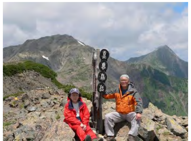
間ノ岳・北岳を背景に

5分間ノ岳に着くが、まったく何も見えない。小休止して下山を開始、9時20分本来泊まるはずであった農鳥小屋へ。ようやく天候が回復して快晴となるなか、9時45分西農鳥岳の急坂に取り付く。標高3000mあたりで稜線にでたが、西からの強風に悩まされながらアップダウンを繰り返し、11時5分西農鳥岳（3051m）と思しき頂に立つが、三角点はおろか標識すらない。11時45分ようやく農鳥岳（3025m）に着く。振り返れば間ノ岳、北岳の雄大な山容が目の前にある。「よく越えてきたな」と感激をかみ締める。周りの景色をカメラに納めて、昼食後先を急ぐ。12時55分大門沢下降点に着く。遭難碑の鐘があり、追悼とこれからの安全を祈念して鐘を鳴らす。ここからは大門沢小屋を目指し、ひたすら降ること3時間、16時5分ようやく本日の行程が終了した。